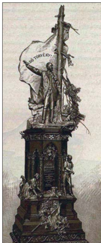
Stróbl Alajos Erdőtörvény című szobrának egy részlete