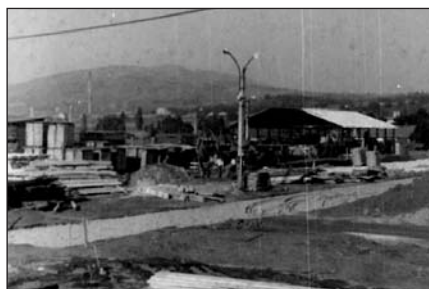
Itt már épül a gyár (1969)

A szerződés megkötése után gyors ütemben elindultak a lépések, a tervezés, az engedélyeztetés, szerződések a kivitelezésre, gépek megrendelése, és minden, ami egy ilyen komoly beruházáshoz kell. A fővállalkozó a Mátrai