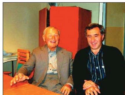
Mester és tanítványa (2004)