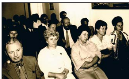
Parkettagyáriak egy központi értekezletén (1986)