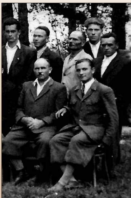
Fényespusztai erdészek (1950)