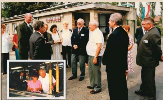
Göncz Árpád a Parkettagyárban