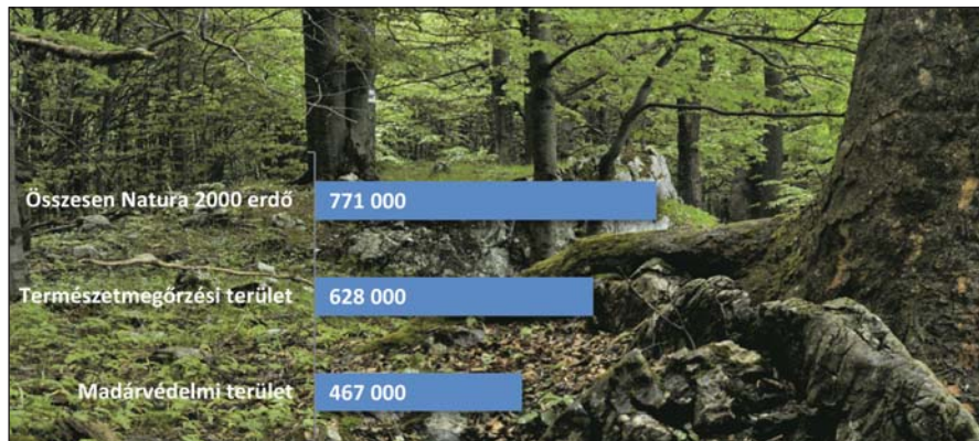
1. ábra. A magyarországi Natura 2000 erdők területe (hektár) összesen és területtípus bontásban

Emellett a Natura 2000 területekre vonatkozó szabályozás egyértelműsíti, hogy nem elegendő a közösségi szempontból védelemre jelölt élőhelyek és fajok megőrzése érdekében tett védelmi intézkedések meghatározása és azok betartása, szükség van a tervezett tevékenység Natura 2000 területre kivetített, átfogó hatásvizsgálatára is. Ennek értelmében a Natura 2000 területen folytatni kívánt tevékenységeket engedélyezésük előtt vizsgálat alá kell vonni és a veszélyeztető tényezők számbavételét követően mérlegelni kell, hogy a védelemhez szükséges minden intézkedést meghatároztak-e, annak érdekében, hogy ha a tevékenység végrehajtásra kerül, az nem fogja veszélyeztetni