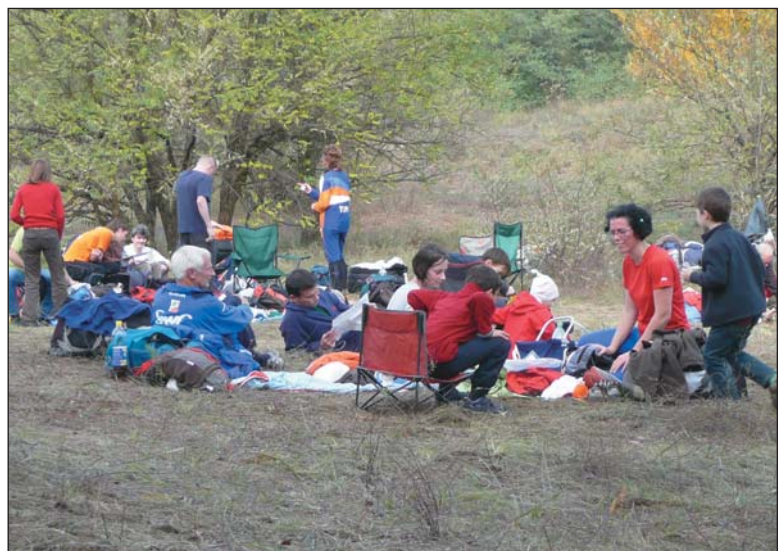
Sport és családi program

A térképnek abban kell segítenie a rendezőket és versenyzőket, hogy megtudják hová lehet elhelyezni, illetve hol található az ellenőrző pontok. Ábrázolja a jellegzetes fákat és sziklákat, a forrásokat, a vadgazdálkodási létesítményeket (pl.: magasles), a talajszelvény gödröket, dagonyákat stb. Megmutatja azokat a domborzati képződményeket, tereptárgyakat, amelyeket a versenyző haladás közben felismer. Tájékoztat a domborzat kitétségeről, lejtési viszonyairól, a talajfelszín állapotáról. A haladás gyorsaságát befolyásoló növényzetről szí-