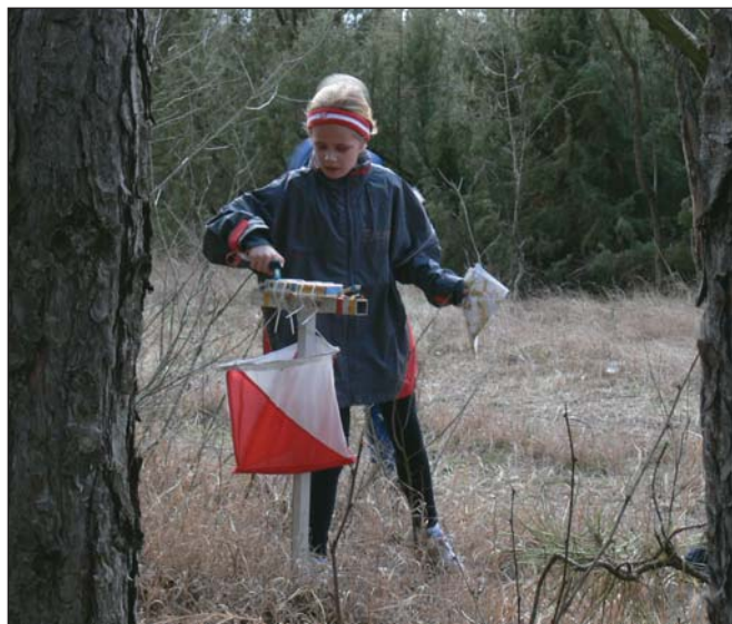
Igazolás a tájfutó bójánál

Az egyes korcsoportokon belüli fokozatok pedig – elit, A, B, C – a feladat fizikai és technikai nehézségében különböznek, más-más kihívást jelentve a kezdők és gyakorlottak számára.