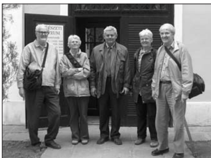
Az Erdészeti Múzeum előtt