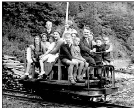
A család vendégeivel a lórén

A Szilvásváradon eltöltött húsz év alatt az időközben kilenctagúra gyarapodott Király családnál nagyon sok rokon, barát, ismerős megfordult. A család szívből jövő vendégszeretete, a gyönyörű vidék, a szépséges erdők, patakok szinte vonzották az embereket, mindig voltak náluk vendégek, a nyári vakációkat pedig egész gyermekesereg töltötte a Szalajkában a Király-gyermekek társaságában.