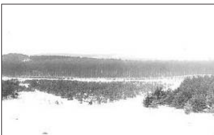
1963-as látkép a 32. köröndtől É felé. Jobb közepén a Lisenko-fenyves