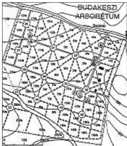
A Budakeszi arborétum térképe (tájékoztató füzet)