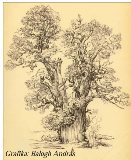
Grafika: Balogh András

A pannon táj ismét szegényebb lett egy természeti értékkel, s a közelmúltra visszagondolva azt kell szomorúan meg-