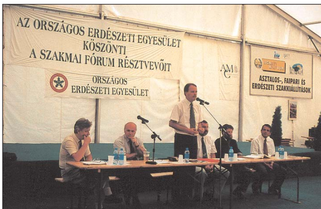
A konferencia elnöksége