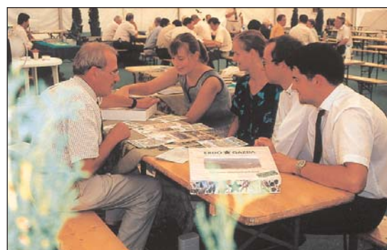
... bemutatja társasjátékát

végzett lelkiismeretes és eredményes munkáját. A legkevesebb, amit megtehetünk, hogy ezúton is megköszönjük tevékenységét és sok sikert kívánjunk.