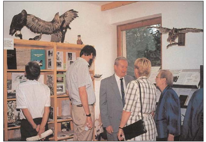
A Szemerédi emlékszoba (névadó közepen)

Ez a gondolata annak az erdészeti kiállításnak, melyet az OEE, Debrecen város Önkormányzata és a Nyírerdő Rt. meghívásával az OEE alelnöke nyitott meg Debrecenben az erdészeti erdei Művelődési Házában.