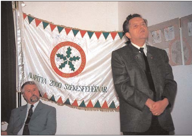
A vándorzászló Debrecenben