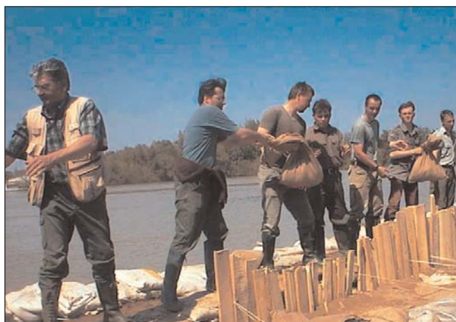
Erdészek magasítják a gátat