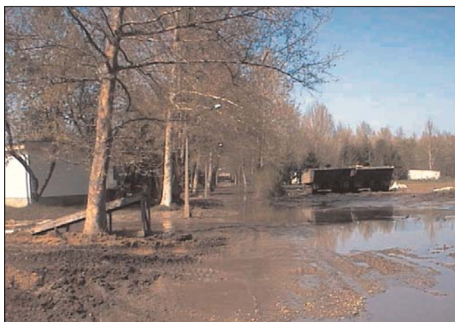
Ez volt a tiszaligeti autóparkoló