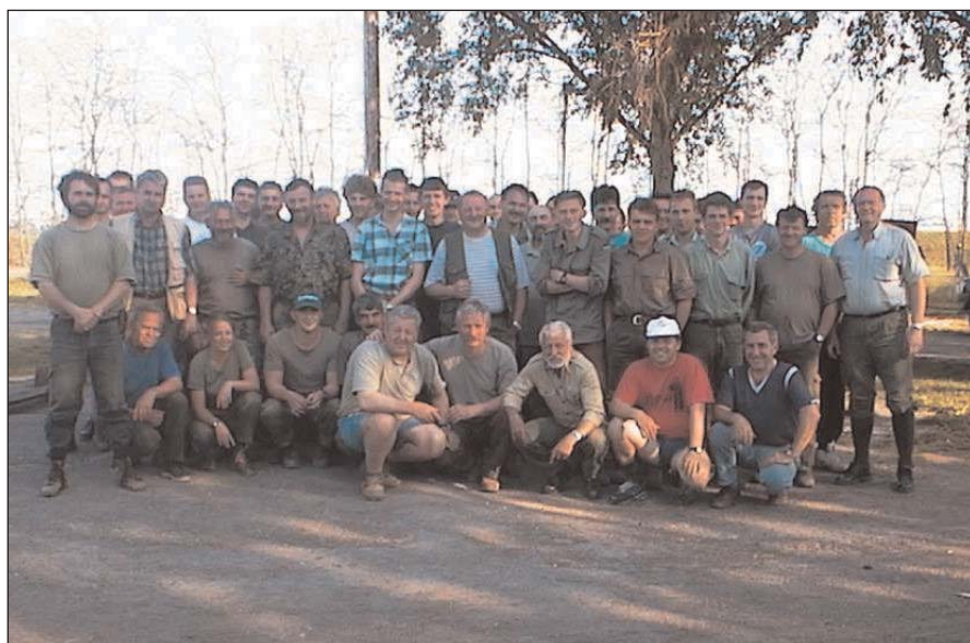
Indulás előtt hazafelé a csapat