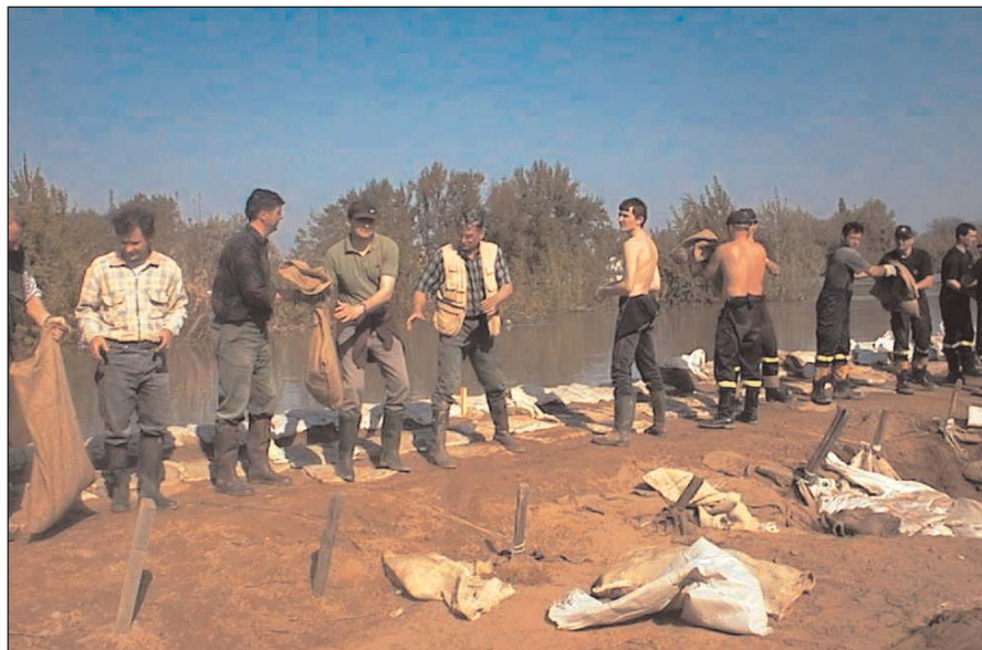
Lengyel önkéntes tűzoltókkal egy láncban

Az évezred tiszai árvizében a jelen tudósításon kívül bizonyára részt vettek más erdészek is, ám a szerkesztőségbe csak az EGERERDŐ Rt. híryanaga jutott el. Az egeri kollégák felajánlották segítségüket a központi árvízvédelmi törzskarnál. Az ötvenfős csapatot a szolnoki védelmi bázisra irányították, ahol a képek tanulsága szerint meg is jelentek és derekasan kivették részüket a védelemben az EGERERDŐ emberei. Azért ezt jó érzés leírni. Köszönet!