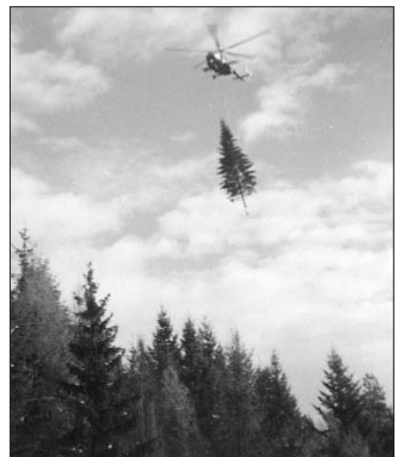
Budakeszről légi úton jutott a Parlament-hez a karácsonyfa